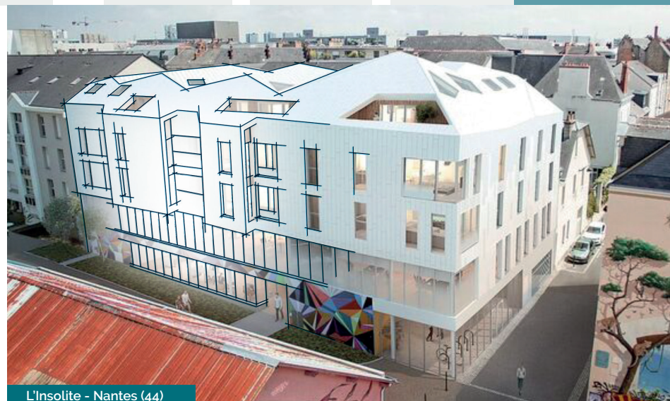
L'Insolite - Nantes (44)