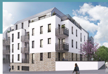
L'Altruiste - St-Herblain (44)