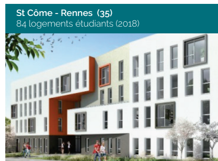
St Côme - Rennes (35) 84 logements étudiants (2018)