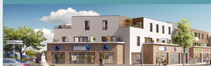
Villa Charlotte - Carquefou (44) 18 logements - 4 commerces (2017)